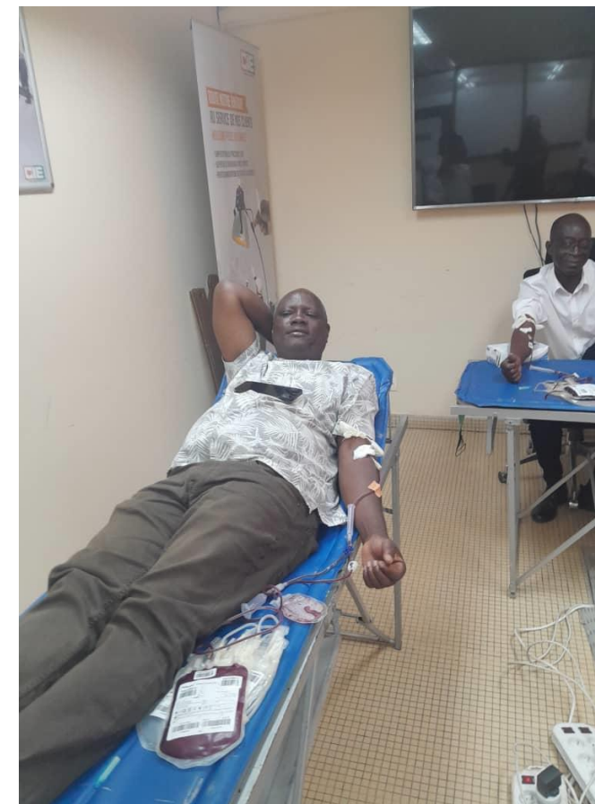
Opération de don de sang