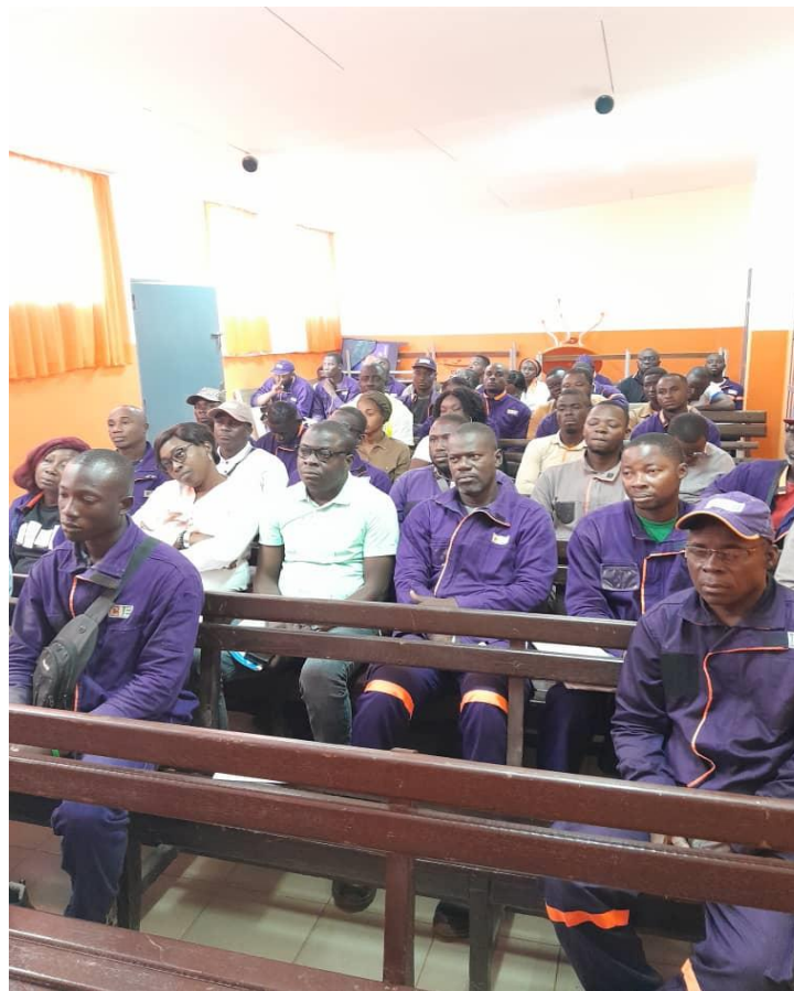
Sensibilisation des agents de CIE