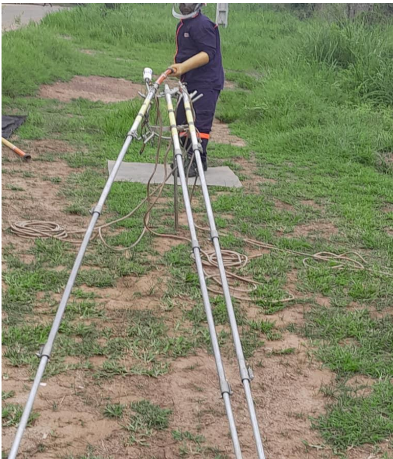
Visite des agents Sur terrain